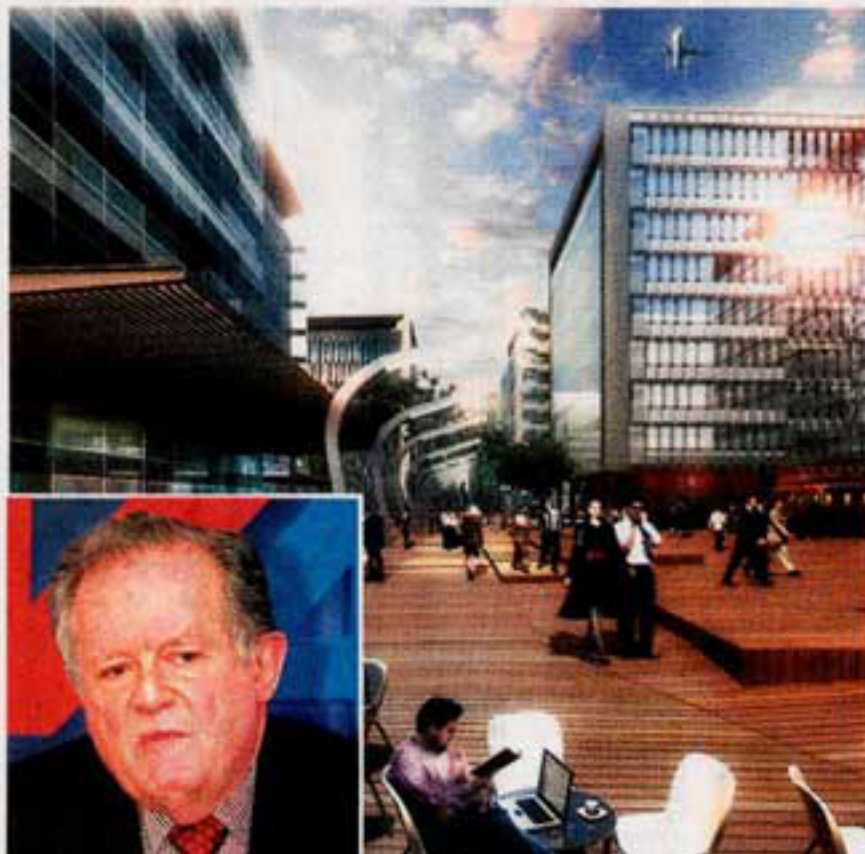
Ciudad Empresarial Sarmiento Angulo tendrá fachadas y redes que responden a parámetros bioclimáticos.

Por su parte, la Organización Luis Carlos Sarmiento Angulo después de liderar, a través de su firma Construcciones Planificadas el desarrollo del centro comercial Centro Mayor (que se inauguró a comienzos de este año) realiza una gran apuesta con el desarrollo de la Ciudad Empresarial Sarmiento Angulo. Este proyecto, que tendrá 18 edificaciones contará, además, un hotel cinco estrellas. Esta misma firma es la encargada de realizar el diseño para expandir la planta de Bavaria ubicada en el municipio de Tocancipa. Así mismo, avanza en tres proyectos de vivienda llamados ciudad Alsacia.